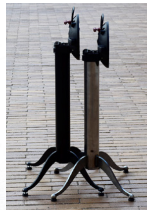
Empilable comme aucune autre table