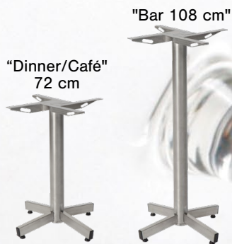
Otras alturas disponibles a petición

StableTable Extreme es una versátil gama de bases de mesa adecuadas para utilizarse en condiciones externas difíciles, pero que también funcionan perfectamente bien en espacios de diseño vanguardista. Las bases de acero inoxidable 316L pueden utilizarse cerca del agua salada. Y con su diseño resistente y atractivo, la StableTable Extreme funciona igual de bien en entornos históricos yxx